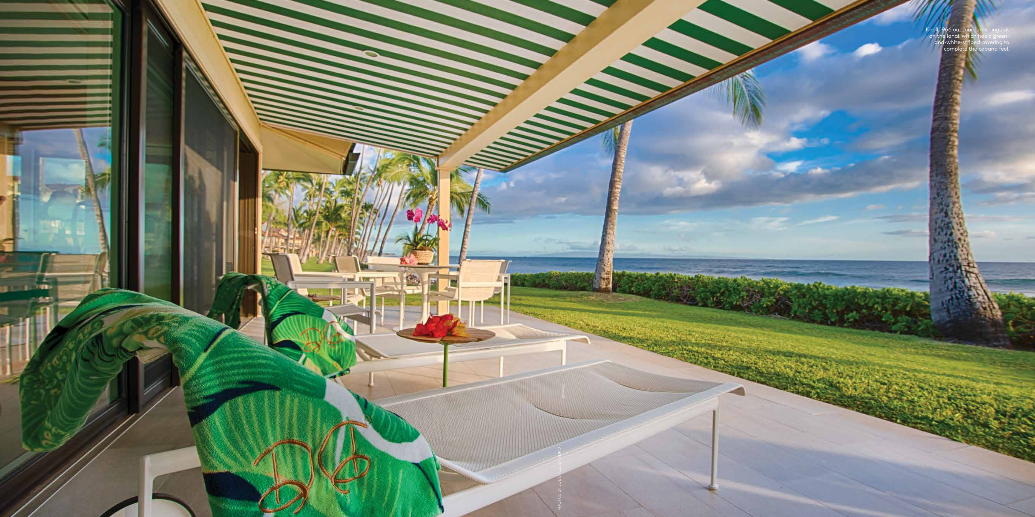
Knoll 1966 outdoor furnishings sit on the lanai, which has a green-and-white-striped covering to complete the cabana feel.