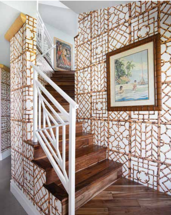
Clockwise from left: The living room walls are painted Raspberry Smoothie, a custom color created by Carleton Varney with Fine Paints of Europe. The chair fabric is Summer Fruits by Dorothy Draper & Company; artwork throughout depicts Hawaiian royalty and vintage Hawai‘i travel posters; the vintage lamp’s hula dancer can still sway.