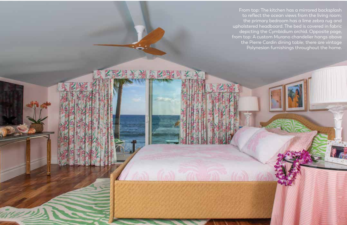
From top: The kitchen has a mirrored backsplash to reflect the ocean views from the living room; the primary bedroom has a lime zebra rug and upholstered headboard. The bed is covered in fabric depicting the Cymbidium orchid. Opposite page, from top: A custom Murano chandelier hangs above the Pierre Cardin dining table; there are vintage Polynesian furnishings throughout the home.

「私はいつもデコレーターという用語を使います。それがヴィンテージだ。」とカールトン・ヴァーニーは宣言する。「インテリアデザインが職業になった時、人々は自分たちを血統書付きにし、自分たちをインテリアデザイナーと呼びたがった。よりシックに聞こえるように。でも、大丈夫。」と彼は続ける。彼のパターンプレイに現れ始めたのと同じくらい大胆な彼の性格。「彼らが言うことを私は気にしない。ある人々は私をインテリアデザイナーと呼ぶ。ある人々は私を講師と呼ぶ。ある人々は私を著者と呼ぶ。」どんな愛称でも、ヴァーニーと彼の豊富な作品ライブラリーを考える時、決定的なタイトルが思い浮かぶ; それは、伝説。